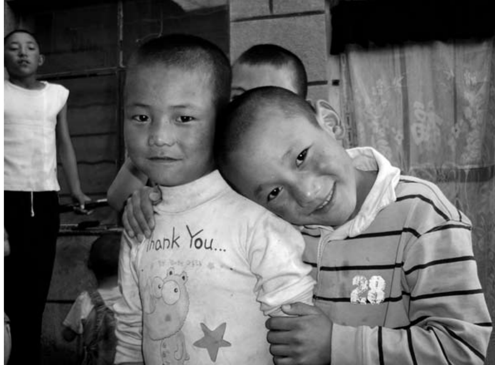
Tibetanske drenge i Lhasa

Udenrigsministeriet har ved flere lejligheder henvist til FN-resolution 1723 (XVI) som begrundelse for kun at anerkende, at tibetanerne har ret til „intern selvbestemmelse“ i modsætning til „ekstern selvbestemmelse“. I sit svar på