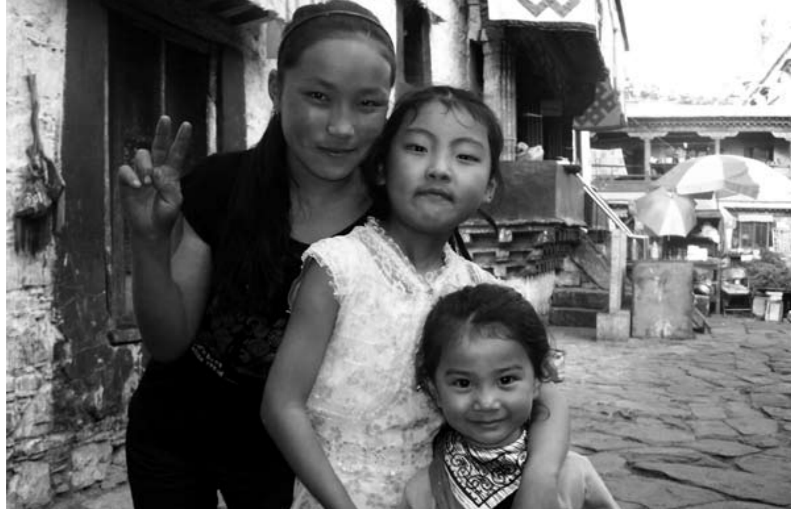
Tibetanske piger i Lhasa © Sundin

I den forbindelse er det vigtigt at understrege, at der er stor forskel på