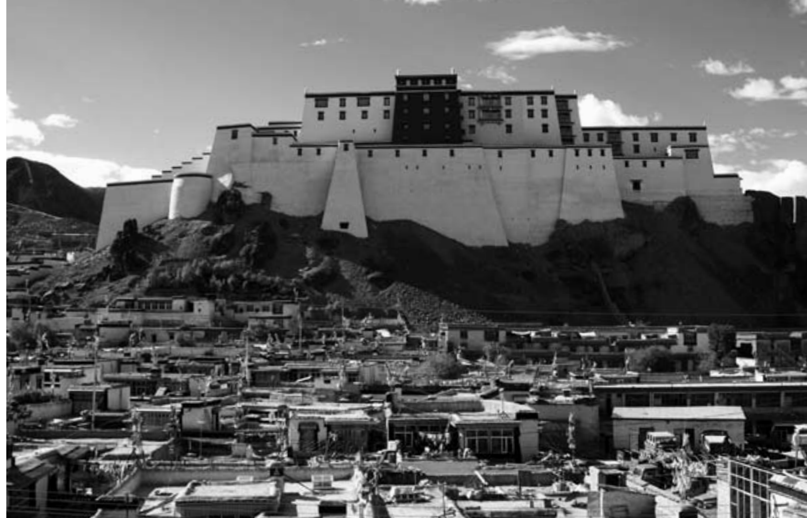
Det genopførte fort i Sbigatse

Men til trods for dette synspunkt er Wang alligevel en vigtig forkæmper for demokrati og menneskerettigheder i Kina, og for en fredelig løsning på Tibetproblematikken i Kina i dag.